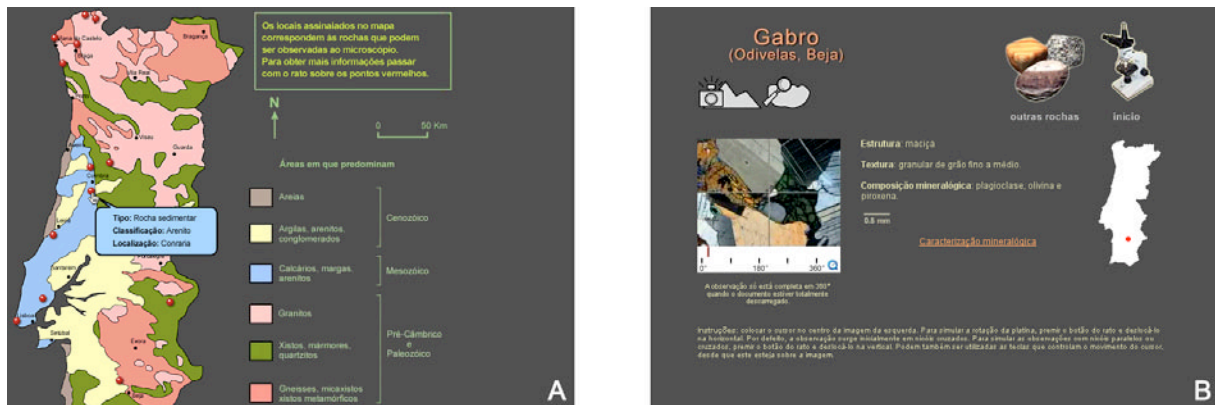
Figura 2 – Capturas de ecrã do hiperdocumento. A- Página que permite o acesso às amostras de rochas a partir da sua localização geográfica; B- Página tipo de apresentação de cada amostra.